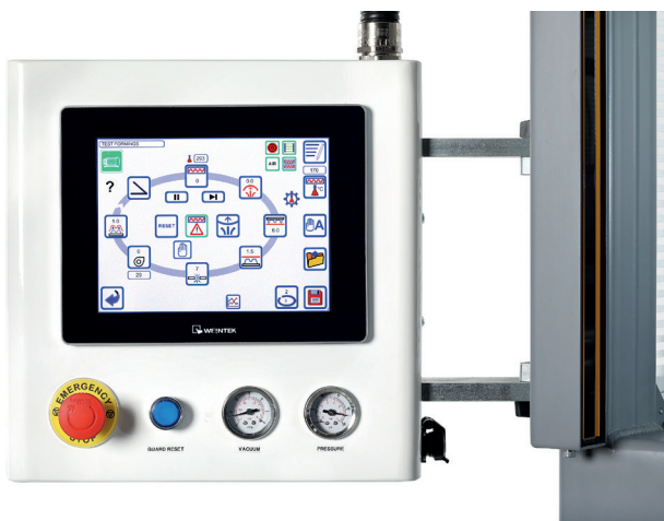
Formech 'Vue du Cycle'

(2) La puissance peut être supérieure et dépend des options sélectionnées avec la machine